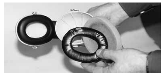
Gehörschutzkapseln pflegen und instand halten.

Informationsbroschüre für die Mitarbeiter/-innen: «Wie bitte? Fragen und Antworten zum Thema Lärm.» (Bestellnummer: 84015.d)