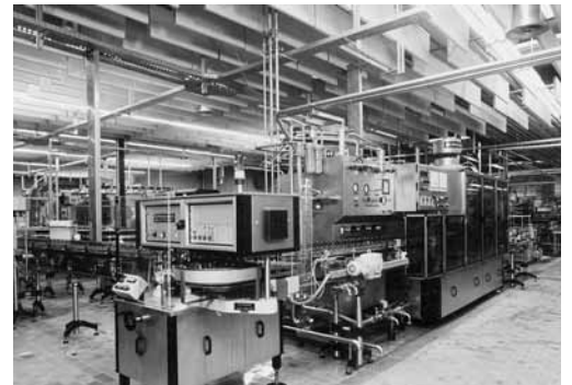
Baffeln aus Steinwolle-Akustikplatten in einer Getränkefirma (Abfüllanlage).

Weitere Informationen: «Lärmbekämpfung in der Industrie» (Bestellnummer: 66076.d) Checkliste «Technische Lärmschutzmassnahmen» (Bestellnummer: 67171.d)