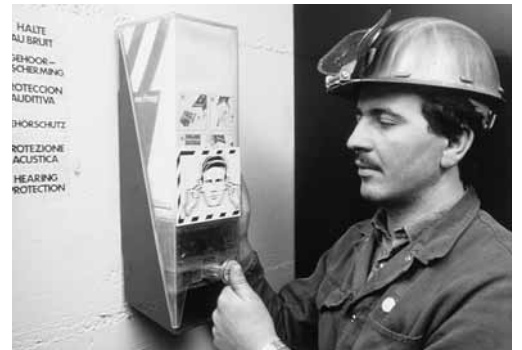
Gehörschutzmittel-Dispenser. Die Gehörschutzmittel müssen jederzeit und ohne Umstände erreichbar sein.